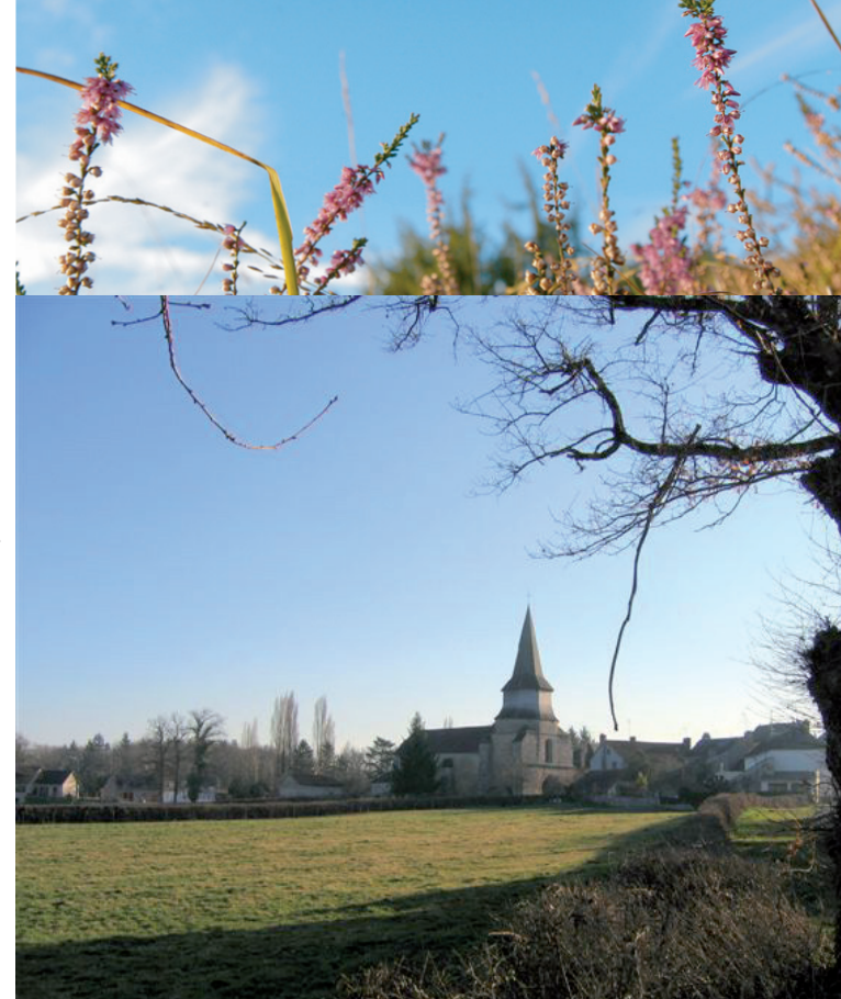
Ne pas jeter sur la voie publique

Cette fiche randonnée est également consultable et téléchargeable sur le site www.randonnee-hautevienne.com . Ce chemin a été conçu prioritairement pour la pratique de la randonnée pédestre. Il est également ouvert aux autres usagers sous leurs responsabilités (cavaliers, VTT...). Pour toute information sur la randonnée, contacter le Comité Départemental de la Randonnée Pédestre 87 : tél 05 55 10 93 87 ou www.ffrandonnee.fr