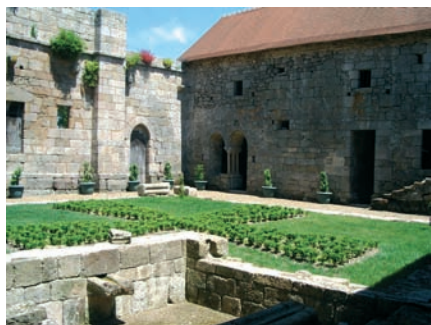
Le monastère Grandmontain des Bronzeaux